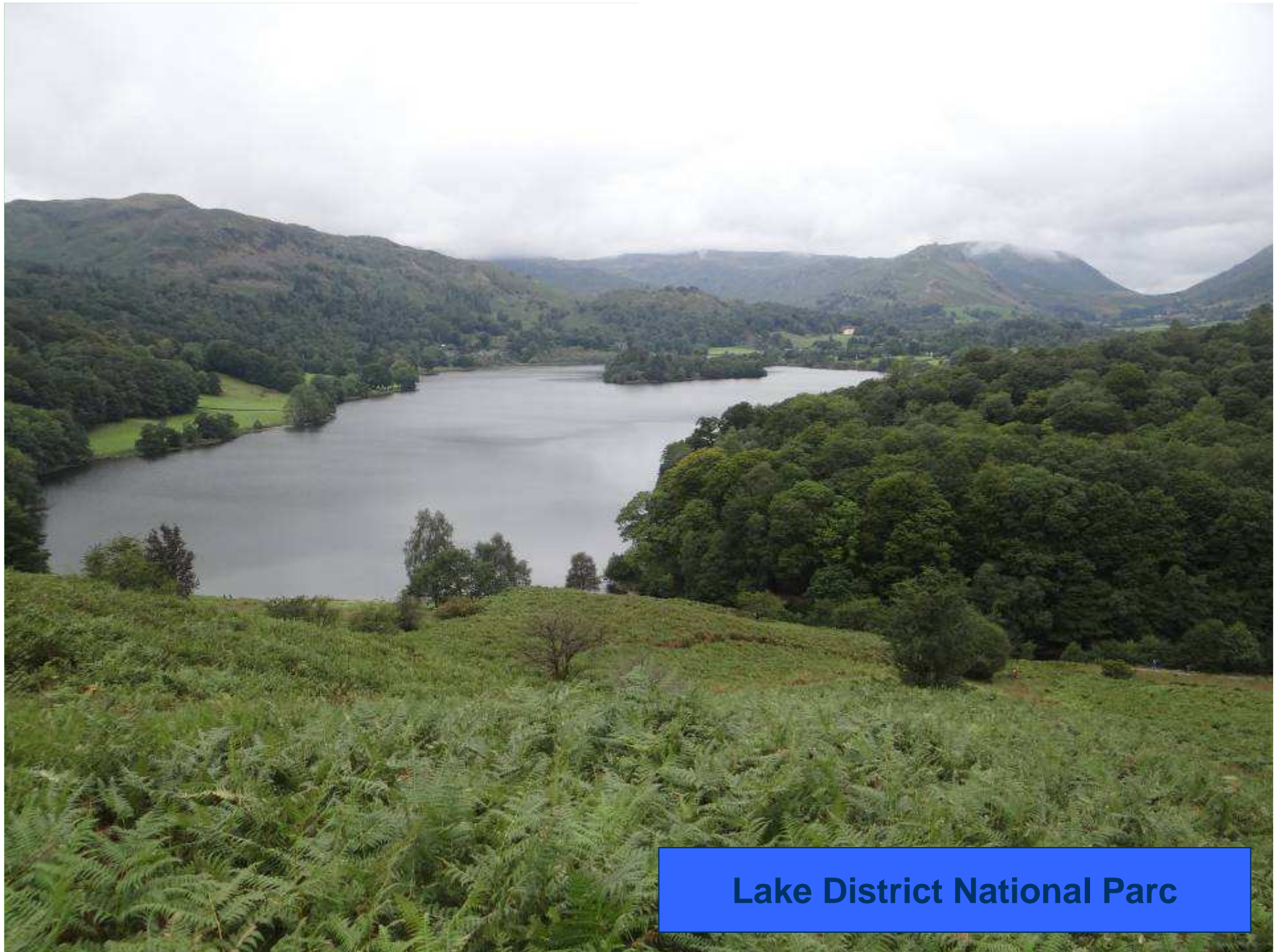
Lake District National Parc